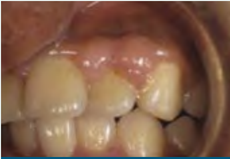
Crecimiento excesivo de las encías