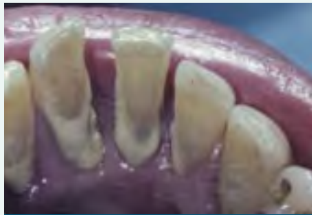
Depósitos de placa en los dientes