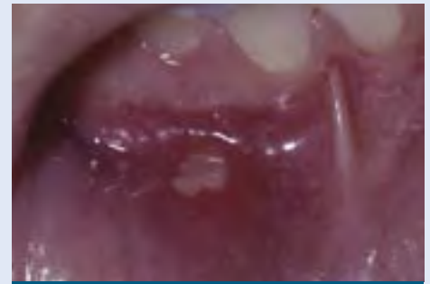
Úlcera de la boca