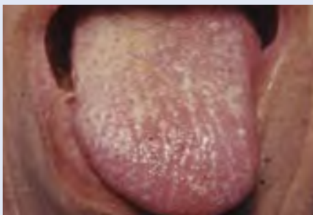
Afta ( candidiasis )

El fumar, la boca seca, la diabetes, y el tener dentaduras aumentan el riesgo de desarrollar aftas en su boca.